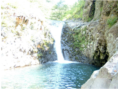
美しい小滝の出迎え

大滝の上流で沢は広い釜を持つ4メートル滝を境に、流れの向きを北東に変えた。バランスを要する滝の右壁を攀ると、連続する滝場の始まりだった。8メートル前後の滑滝群、磨かれたゴルジュの中を一気に流れ落ちる長さ30メートルほどもありそうな豪快なトイ状の滝、穏やかな陽射しを全身に浴びてしばらく寝転がっていたくなるような平滑、上の淵からの流れが岩の下を流れて流れ込んでいるはずなのに水面は鏡のように静まり返り波ひとつなく、あたかも上の淵の流れは総て地中深く吸い込まれているかのように見える奇妙な淵など、次から次に現れる自然の造形の妙に遡行は飽きることなく、私たちはすこぶる愉快に高度を稼いだ。