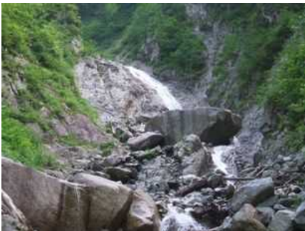
東横川 F1 20m

このまま谷筋を辿るのは困難で時間もかかると判断し、谷から離れることにした。右岸の尾根に出るべく水の流れている細いリンゼに取り付いた。標高2,250メートル付近であった。落石に注意してリンゼを100メートルほど登ると開けた草付きの斜面となり、この斜面をトラバースすると安定した伊那前岳の肩から東横川に向かって東南東に伸びる尾根の背に立つことが出来た。谷の上部は雪渓で埋まっていたので長谷部新道を探すのは諦め、そのまま尾根の藪を漕いで山頂直下の登山道に出た。