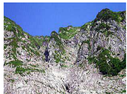
V字壁と右俣リンネ

結局、この日幽ノ沢に入ったのは私たちだけで、貸し切りであつたが、あの暑さを考えると頷ける。要所でハーケンが腐って折れ、シュリングにぶら下がっているもの、錆びて薄くなり穴の一部が開きそうになっているものなどがあり、その状態を見るとボルトもどれだけ信頼できるか確信が持てない状態であつた。新たにハーケンを打ち増ししようとしても適切なリスには折れて残つたハーケンが詰まっている。そんな中ペツルが唐突に打つてある場所が2箇所確認できたが、昨年遭難があつたと聞き、搬出用のものかと想像した。