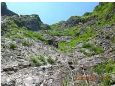
V字壁右ルート5ピッチ目

結果的に石楠花尾根が終了点となった。靴を履き替えて稜線を目指す。ここから堅炭尾根まで15分程度のところであったが、踏み跡がなく、右のルンゼに入った。すぐそこなので何とかかなと思つたがかなりの急登で、見通したが甘かつたことを思い知る。ルンゼは濃密な笹藪となり足場のない小滝に苦戦し、やっと抜けたと思つたら壁が出て、これを越えたらようやくゆるい草付きとなり、数分で堅炭尾根に出た。結局2時間近くもかかってしまった。振り返ると石楠花尾根が一望できる。左の藪をちょっとこいで、右の尾根に上がれば、15分だったのかなあと思うと、情けない。しかし、私にとってはこれも良き経験であつた。天気が良くてなによりだつた。