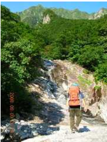
幽ノ沢出合に入る

ロープウェー駅5:30 --- 一ノ倉沢出合6:15 --- 幽ノ沢出合6:40 --- T2 12:30) --- 石楠花尾根 16:30 --- 中芝新道 18:15 --- 一ノ倉岳 19:45 --- 肩ノ小屋 21:45