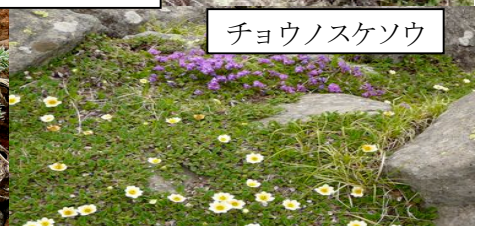
チョウノスケソウ