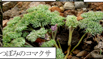
つぼみのコマクサ