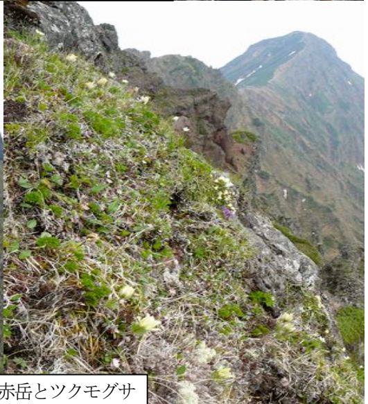
赤岳とツクモグサ